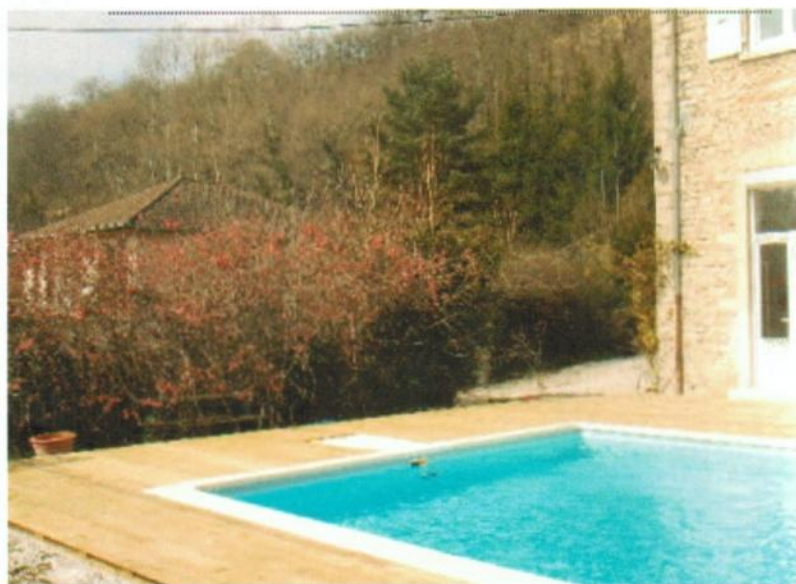
Lame Terrasse MELEZE Profil : Lisse Section 27x145